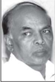
பொருளாதார அபிவிருத்தி பிரதி அமைச்சர் முத்துசிவலிங்கம் பா.உ (இ.தொ.கா)

பறிக்க வேண்டிய கொழுந்தின் அளவை ஒரே அளவாக வைத்திருக்காது சந்தர்ப்பத்திற்கேற்ப கூட்டுவதும் குறைப்பதும் நடைபெற வேண்டும்.